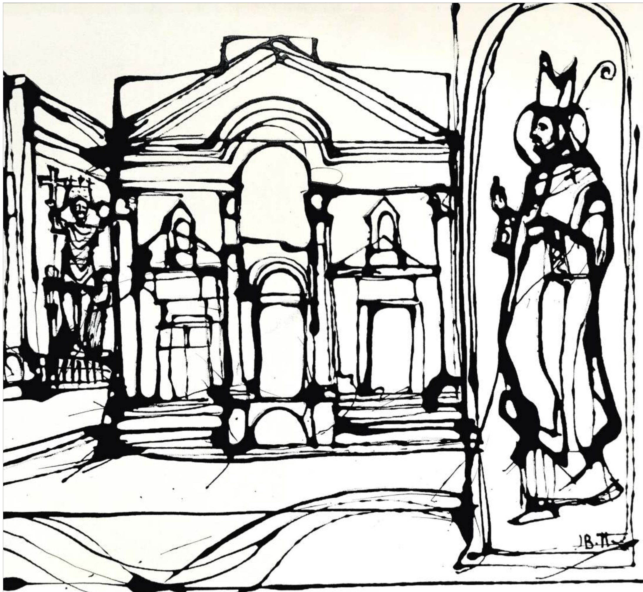
Josip Botteri Dini / Akademski slikar / Sveti Dujme zaštitnik grada / 50x60 cm / Akrilik na platnu / 2015. g